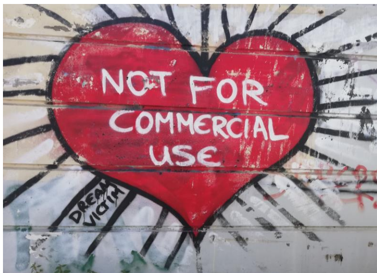
Graffiti de Dream Victim.