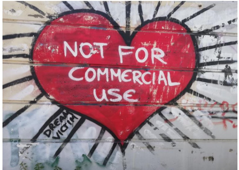
Graffiti de Dream Victim.