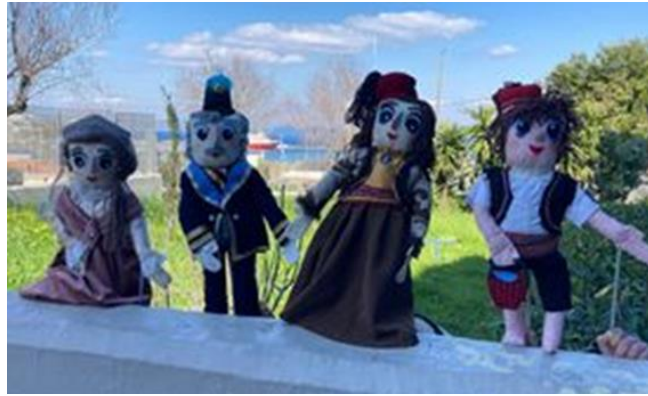
Εικόνα 5: Sarrigeorgiou, G. (2021). Οι μαριονέτες που δημιούργησε το 3ο Εργαστηριακό Κέντρο Ανατολικής Αττικής. [Photograph]. Rafina. 3rd Laboratory Center of East Attica.