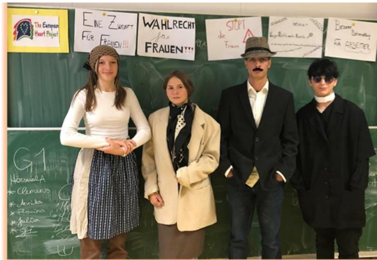
Εικόνα 2 Rembart, R. (2021). Δραστηριότητες κατά τη διάρκεια της εβδομάδας του έργου στο PMS. [Φωτογραφία]. Graz. Pädagogische Hochschule Steiermark