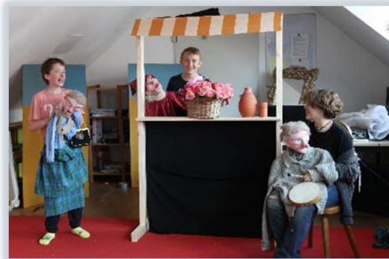
Εικόνα 1: Linde, S. (2022). Κατασκευή μαριονετών για μικρού μήκους ταινίας. [Φωτογραφία]. Welten. Kolibri Schule.

Η έννοια της "εκπαίδευσης κατά της ριζοσπαστικοποίησης" υπάρχει ήδη εδώ και πολύ καιρό και οι εταίροι του έργου υποστηρίζουν την προσέγγιση αυτή 100%. Η σύγχρονη έρευνα του εγκεφάλου έχει αποδείξει επαρκώς ότι αυτό δεν μπορεί να λειτουργήσει μέσω της απλής διδασκαλίας ημερομηνιών και ιστορικών γεγονότων. Για να διεγερθεί η ολιστική μάθηση, πρέπει να αγγιχτούν και τα συναισθήματα. Γι' αυτό και αποτελεί κοινή πρακτική να εμπλέκονται οι μαθητές. Για παράδειγμα, τους πηγαίνουν σε αυθεντικούς τόπους της ναζιστικής φρίκης και τους δείχνουν ντοκιμαντέρ και ταινίες μεγάλου μήκους που προκαλούν αποτροπιασμό, τρόμο και αίσθημα αδυναμίας. Αλλά η προσέγγισή του μπορεί επίσης να διεγείρει στους μαθητές ένα βαθύ αίσθημα δυσπιστίας απέναντι στον εαυτό τους και στην ανθρωπότητα γενικότερα.