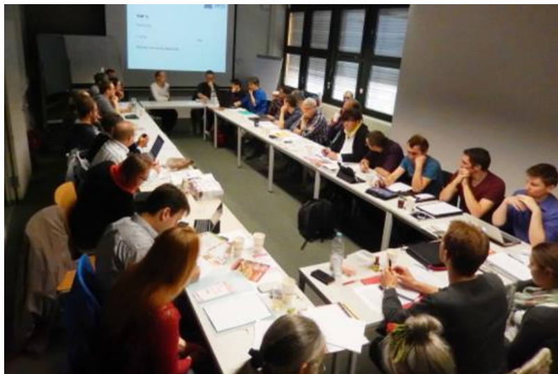
Abbildung 1: Lehrer:innen-Konferenz.

Genauso wenig, wie es den Normschüler gibt, gibt es die Normlehrerin. Wenn Sie sich in Modul 1 mit der Theorie des Falschen Selbst beschäftigt haben, sehen Sie die Gefahr, die damit verbunden ist, die eigenen Bedürfnisse zu überhören: man unterdrückt nicht nur die eigene Lebendigkeit, sondern man gefährdet zusätzlich seine psychische und physische Gesundheit. Darüber hinaus beginnt man auch damit, andere abzulehnen, wenn sie ihre Gefühle und Bedürfnisse zum Ausdruck bringen. Dies äußert sich in Sarkasmus, Abwertung von anderen und unterdrückten Aggressionen. Um den Lebensraum Schule menschlicher zu gestalten, müssen wir also unsere eigenen Grundbedürfnisse und die der anderen achten.