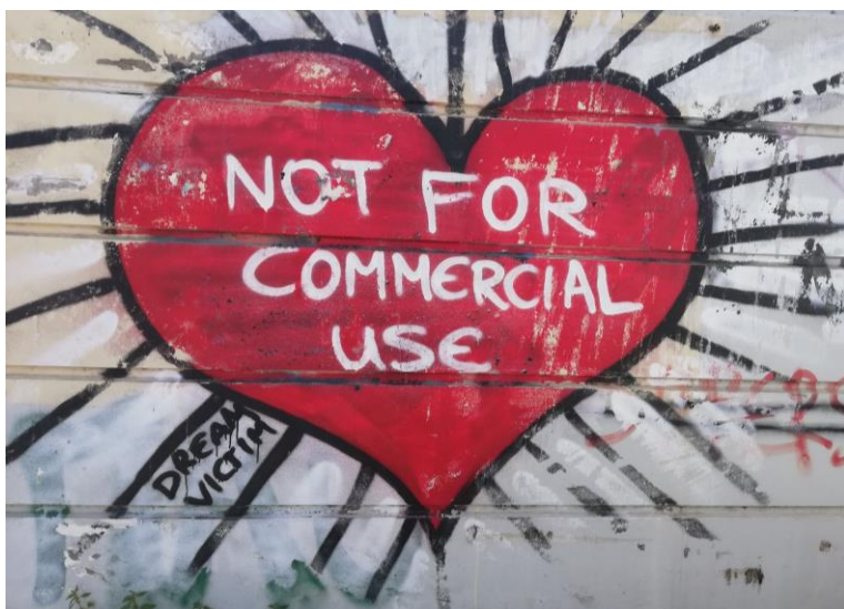
Φωτογραφία: Φωτογραφία: Παντελής Μπαλαούρας, CC-BY-NC-SA. Γκράφιτι από το θύμα των ονείρων.